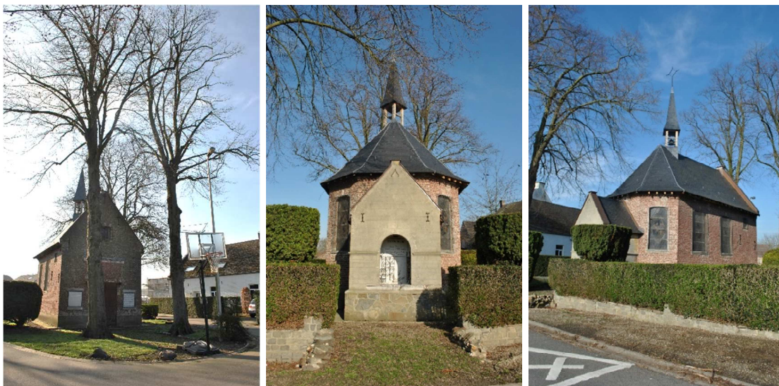
Figuur 1, Kapel in huidige context

De opmaak van het beheersplan omvat het als monument beschermd pand op kadastrale nummer 666 en de onmiddellijke omgeving rond het monument, beschermd als dorpsgezicht. De kapel is gelegen langs de Willibrordusweg en de Aldeneikerweg, beperkt omgeven door groen. De kapel met rechthoekig grondplan en driezijdige koorsluiting sluit aan de oostzijde aan op de zogenaamde Heilige Willibrordusput. De kapel dateert uit het derde kwart van de 17 e eeuw en werd beschermd omwille van haar (architectuur)historische en volkskundige waarde. Verder is de kapel omgeven door groen. De toegang wordt geaccentueerd door lindebomen. Deze werden samen met de onmiddellijke groene omgeving van de kapel beschermd als dorpsgezicht en dragen bij tot de esthetische erfgoedwaarde van het monument. Ze zullen als dusdanig worden opgenomen binnen het beheersplan. Het groen wordt specifiek vermeld in het beschermingsbesluit als 'het noodzakelijk biotoop voor deze kapel' . Het beheersplan omvat een gedetailleerde beschrijving van het monument en het omliggende gebied met als doel het vormen van een gefundeerde visie voor de toekomst van de kapel.