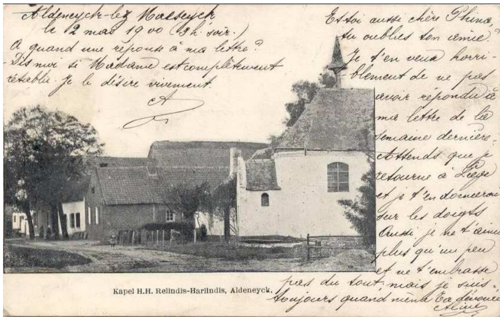
Figuur 4, Kapel in 1900 (Delcampe)

De kapel, gesitueerd in de as van de Willibrordusweg, is een klein bakstenen gebouw met zadeldak, dakruiter en driezijdig gesloten koor. De enige toegang bevindt zich aan de westzijde. Aan de oostzijde bevindt zich de secundaire uitbouw die over de oude waterput is gebouwd. Op het stuceliëf binnen in de kapel staat de kapel nog afgebeeld zonder puthuis. Boven de oude put is een houten 'haal' afgebeeld. Ook is de materialisatie en geveluitwerking van het puthuis anders dan deze van de kapel zelf, dewelke ouder is. De gevels hebben door de jaren heen verschillende afwerkingen gekend, zo toont onder andere een foto uit 1900 de kapel in een volledige witte afwerking. In de inventarisatie wordt hier dieper op in gegaan en worden tevens andere bouwsporen verder toegelicht.