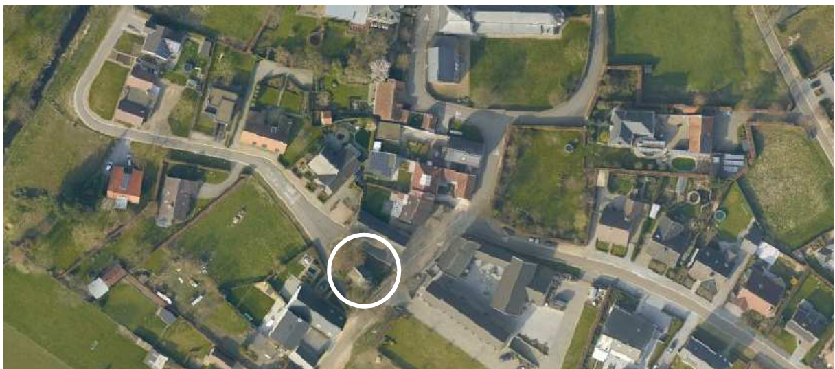
Figuur 3, Luchtfoto 2013-2015