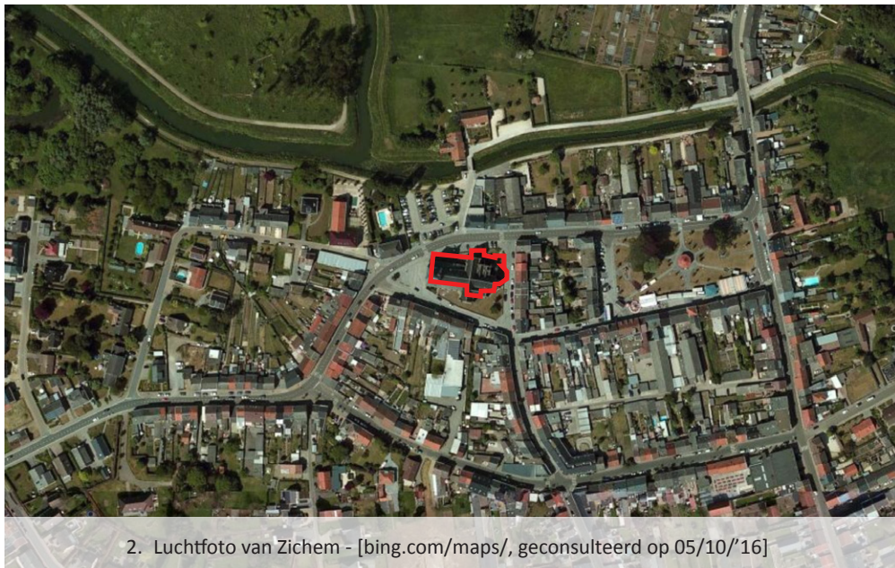
2. Luchtfoto van Zichem