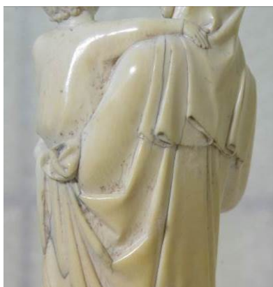
Witte donzige schimmelvlekken op de rugzijde.

De schimmelvlakken werden eerst mechanisch verwijderd met een museumstofzuiger met regelbare zuigkracht en uitgerust met Hepa-filter. Het oppervlak werd vervolgens ontsmet met een wattenstaafje met ethanol.