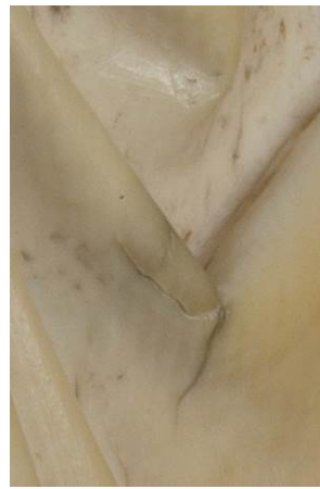
Losgekomen element op de rugzijde.