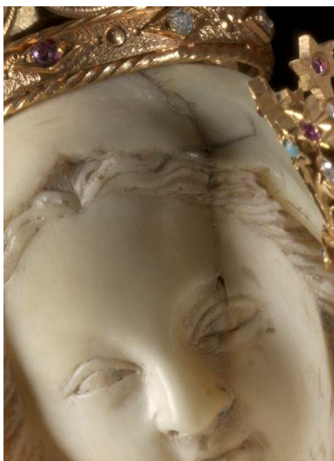
Barst in het aangezicht.