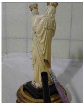
Verwijdering met stofzuiger en zachte kwast.