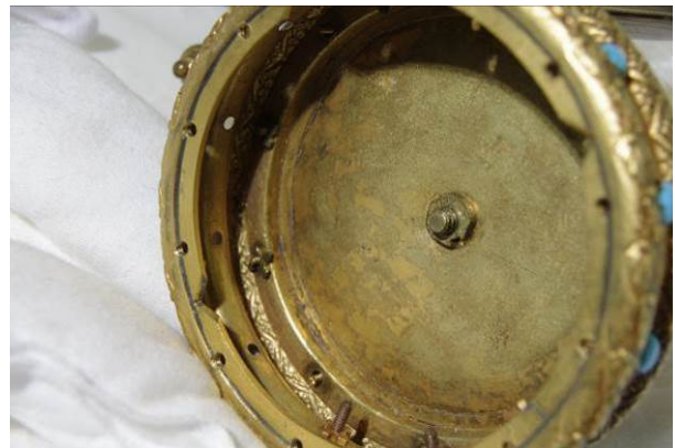
Binnenzijde met vastgevezen vlindermoeren.