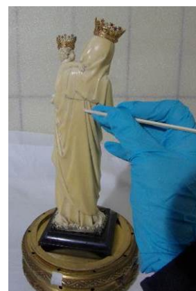
Ontsmetting met wattenstaafje en ethanol.

Ook de stomp werd ontsmet. Het beeldje werd daarna terug onder stomp geplaatst en de stomp dichtgemaakt.