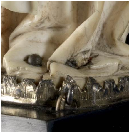
Nagel in het voetstuk en lijmresten van herlijmd element.