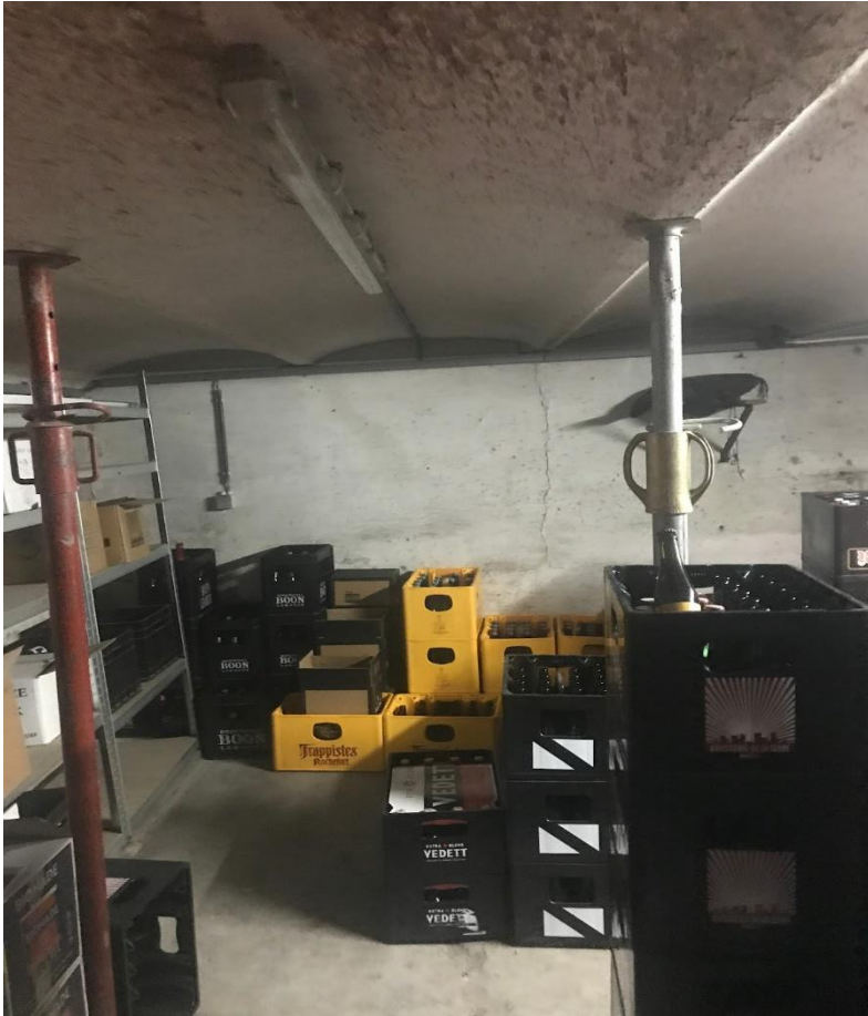
3.14 (Bier-) Kelder, voorzijde, gewelven en ondersteuning gelagzaal