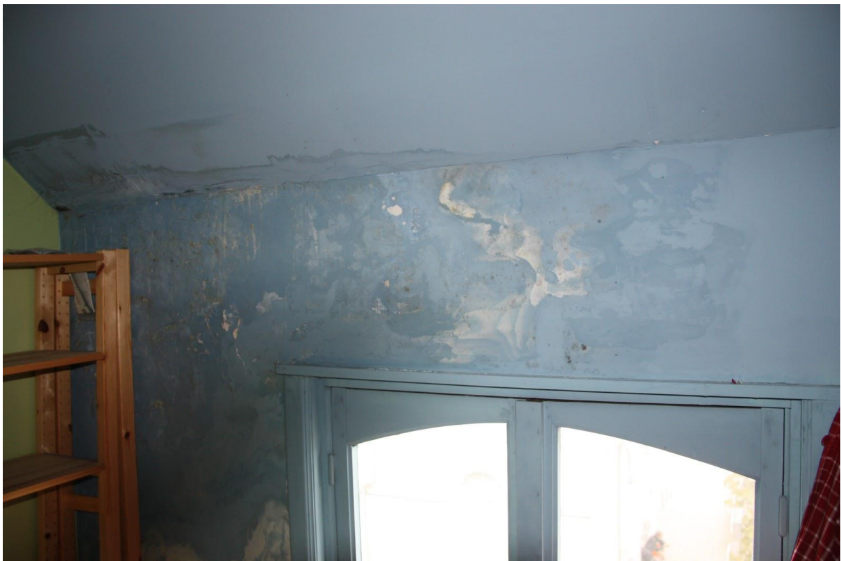
Verdieping 2, voorzijde, kamer 2 (centraal); vocht- en schimmelvorming door lekkende dakgoot