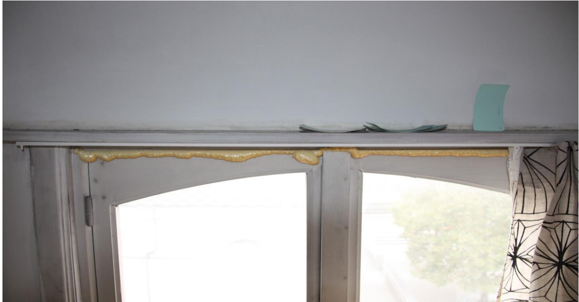
Verdieping 2, kamer 1 voorzijde, idem infra