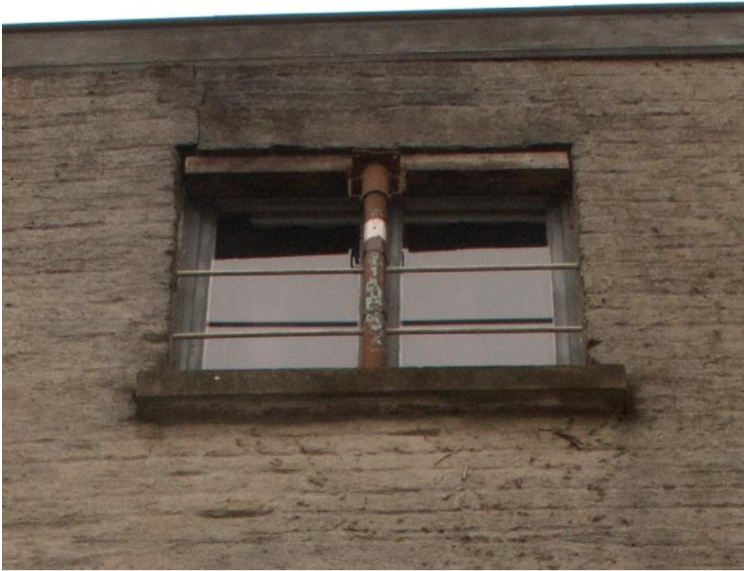
Verdieping 2, achterzijde, gestutte strek boven raam, te vervangen raam