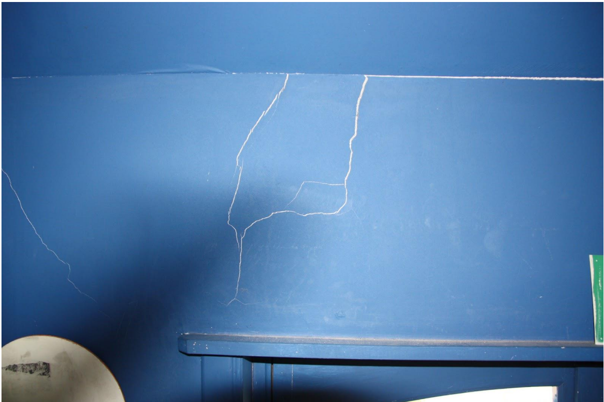
Verdieping 2, voorzijde, kamer 3 (boven poort), gescheurde stucwerken (ten gevolge van funderingswerken nieuwbouw Stationsplein 12)