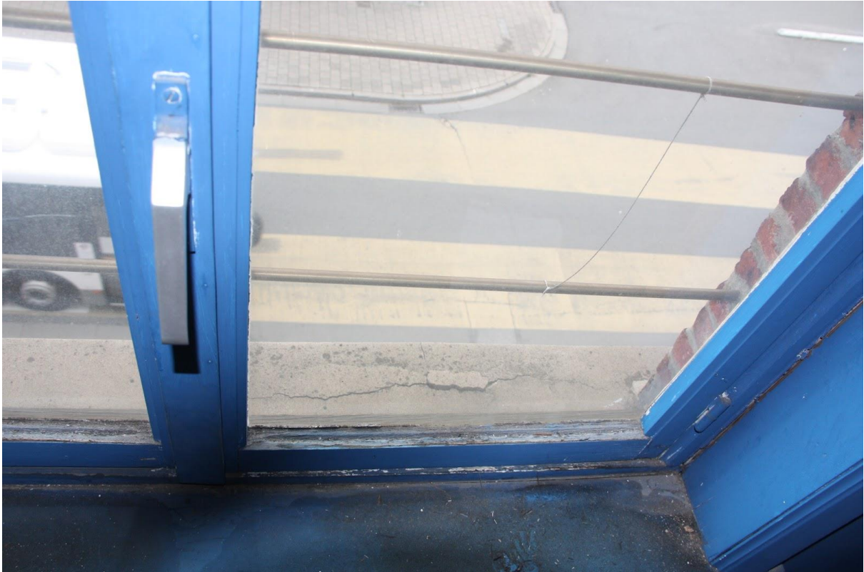
Verdieping 2, voorzijde, kamer 3 (boven poort), schade aan raam en balkon