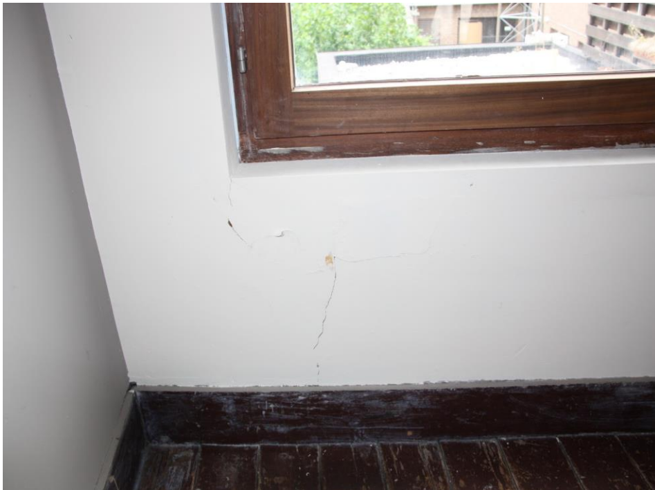
Traphal (tussen verdieping 1 en 2), scheur in plaasterwerk en bakstenen