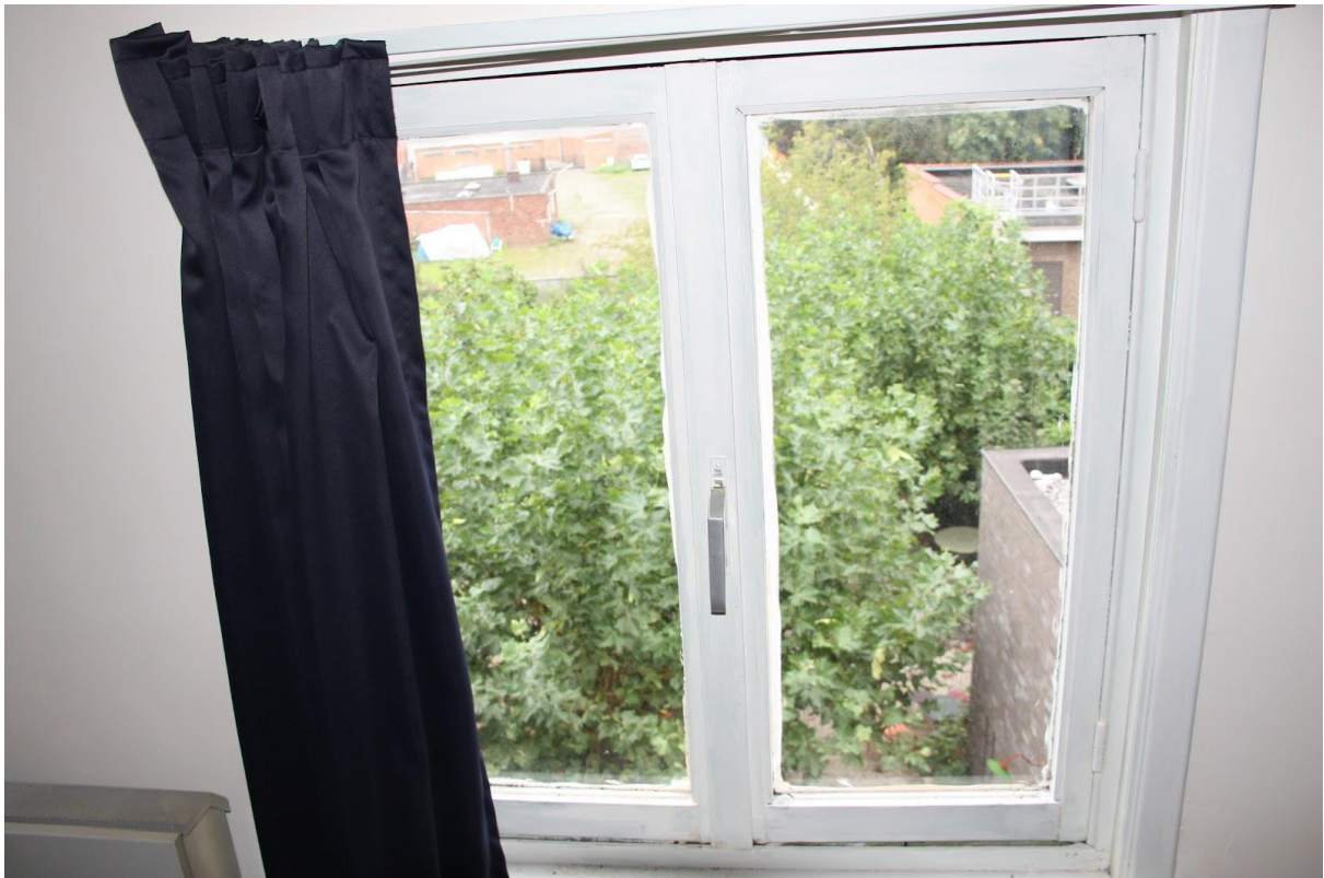
Verdieping 2, achterzijde, slaapkamer 1, te vervangen raamwerk