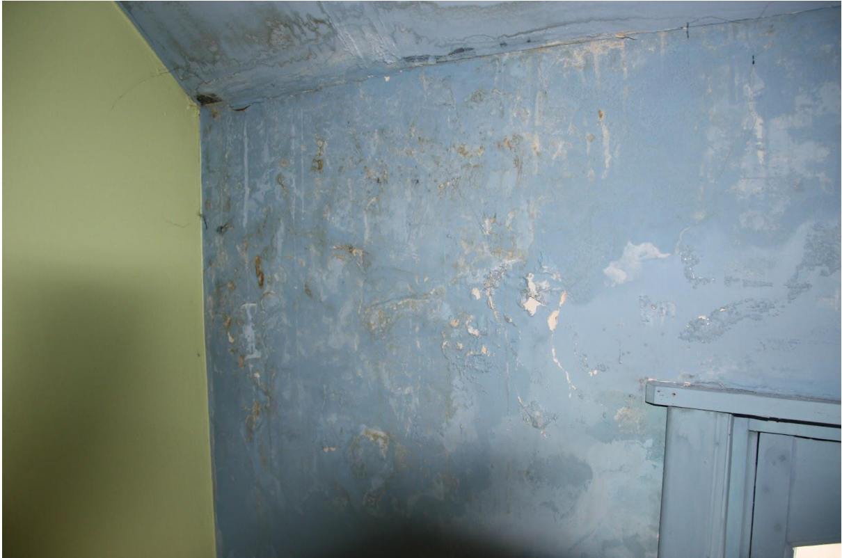
Verdieping 2, voorzijde, kamer 2 (centraal), detail vocht- en schimmelvorming