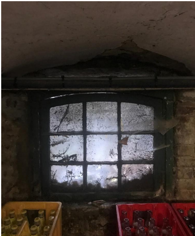
3.13 (Bier-) Kelder, voorzijde, oorspronkelijk raamwerk, ontbrekende isolatie