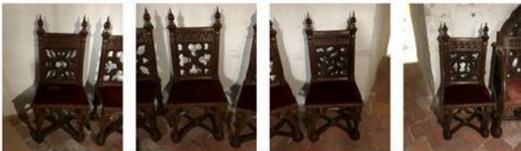
Afb. 251. Neogotische stoelen met rechthoekige rug en zonder armleuningen.

In de kelder (K.0.12) zijn er acht stoelen aanwezig die alle met een andere detaillering zijn uitgewerkt. Er zijn vier stoelen met rechthoekige rug en zonder armleuningen aanwezig, en vier stoelen met drielobvormige rug en met armleuningen. De zitjes van de stoelen zijn bekleed met rood fluweel.