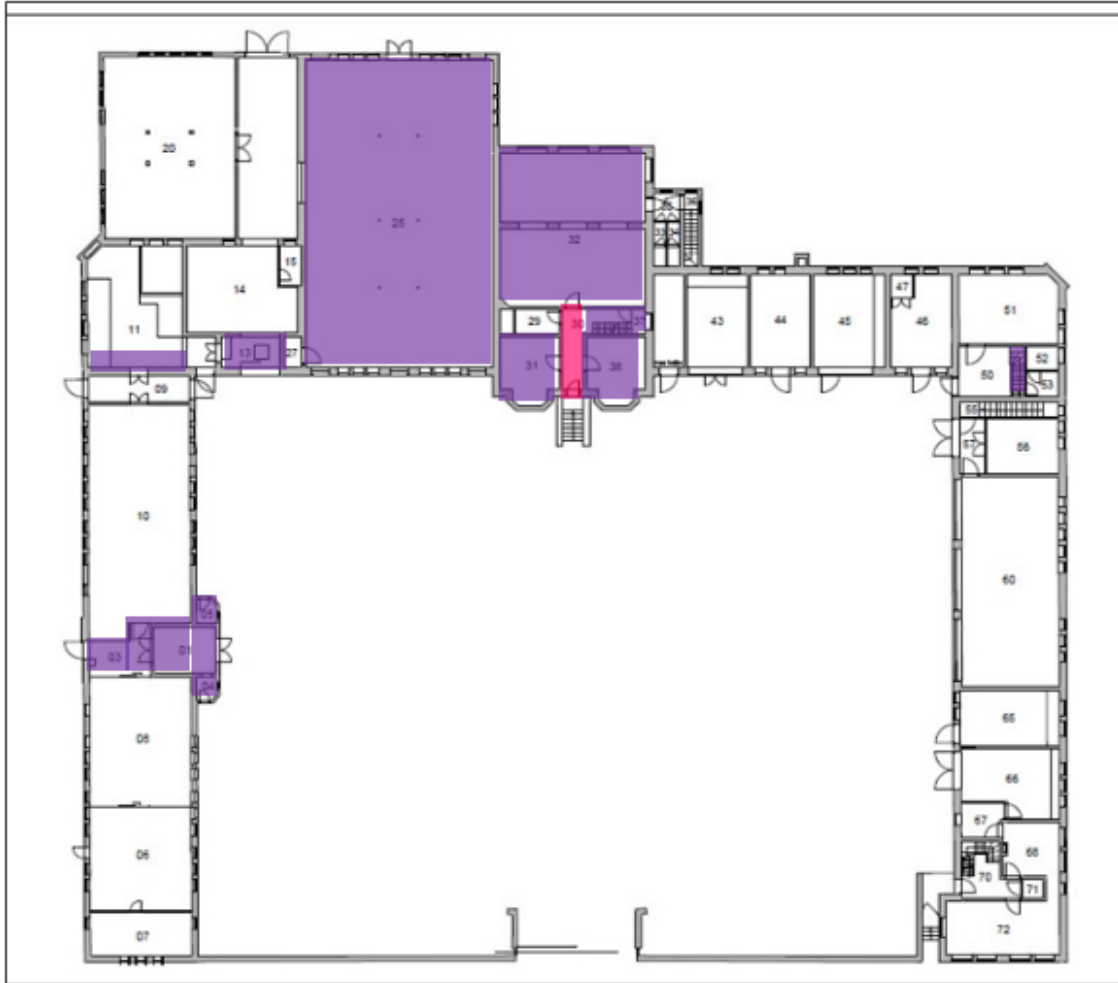
119 – Grondplan van de gelijkvloerse verdieping van het hoofdgebouw van TRANSfarm te Lovenjoel opgemaakt door de Technische Diensten KU Leuven met aanduiding van de erfgoedwaarden in het interieur.