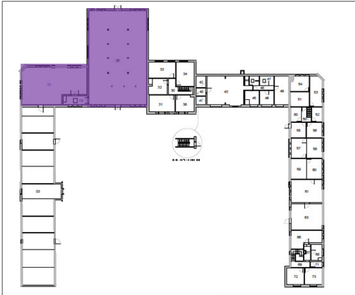
120 – Grondplan van de eerste verdieping van het hoofdgebouw van TRANSfarm te Lovenjoel opgemaakt door de Technische Diensten KU Leuven met aanduiding van de erfgoedwaarden in het interieur.