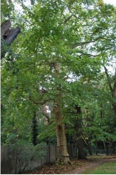
Gewone plataan (5).