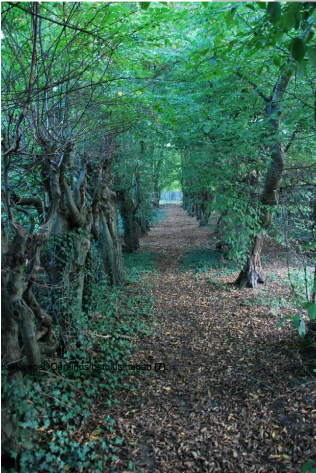
Kerkwegel, Carpinus betulus hagen (7).