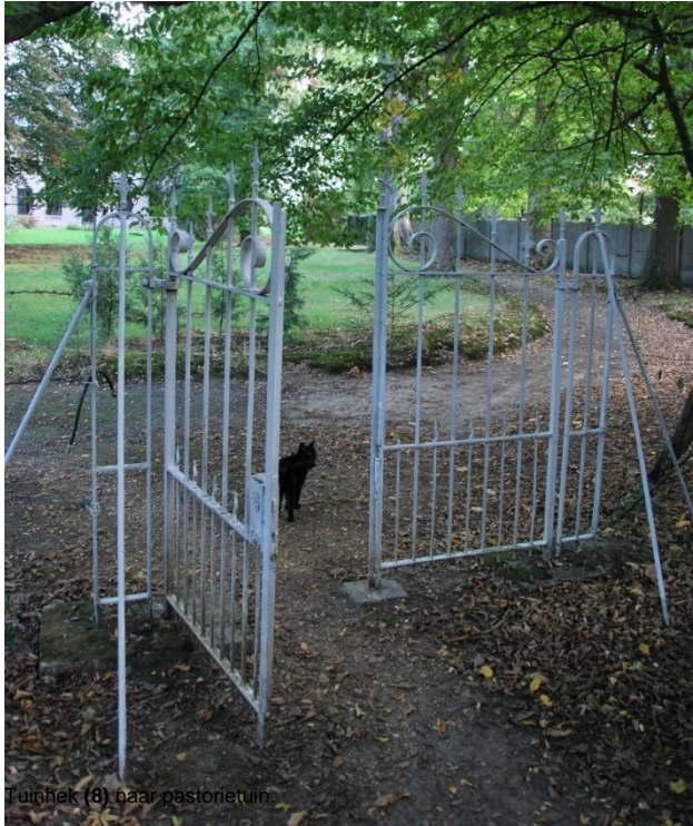
Tuinhek (8) naar pastortuin.