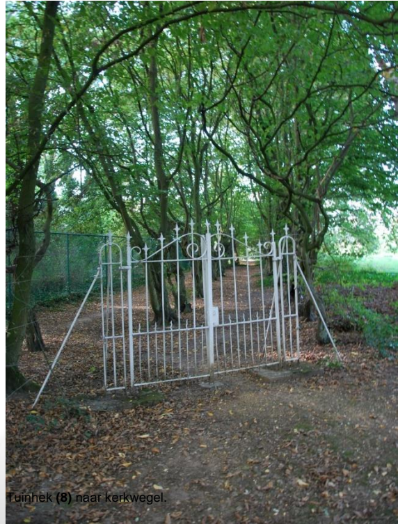
Tuinhek (8) naar kerkwegel.