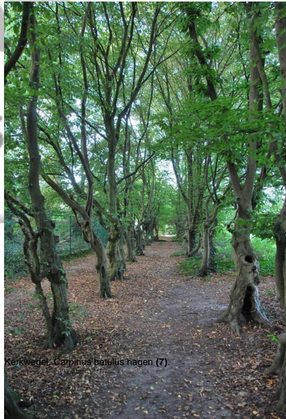
Kerkwegel, Carpinus betulus hagen (7).