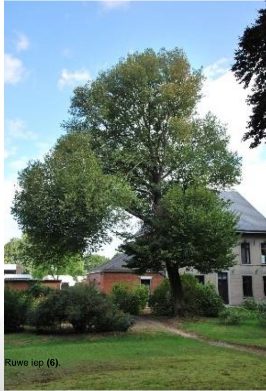
Ruwe iep (6).