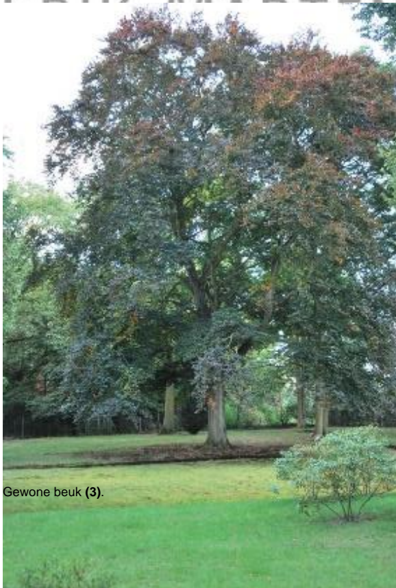
Gewone beuk (3).