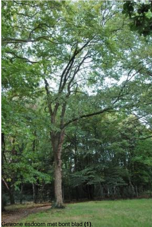
Gewone esdoorn met bont blad (1).

Uitgevoerd door Architectenburo Erik Martens & Partners bvba, Heirweg 12 te 3680 Maaseik. Versie 2019 (september).