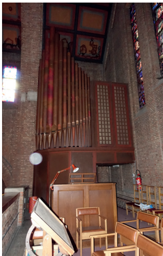
afb. 2: Het orgel