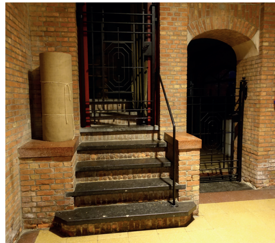
afb. 3: Toegang naar het doksaal via deze trappartij