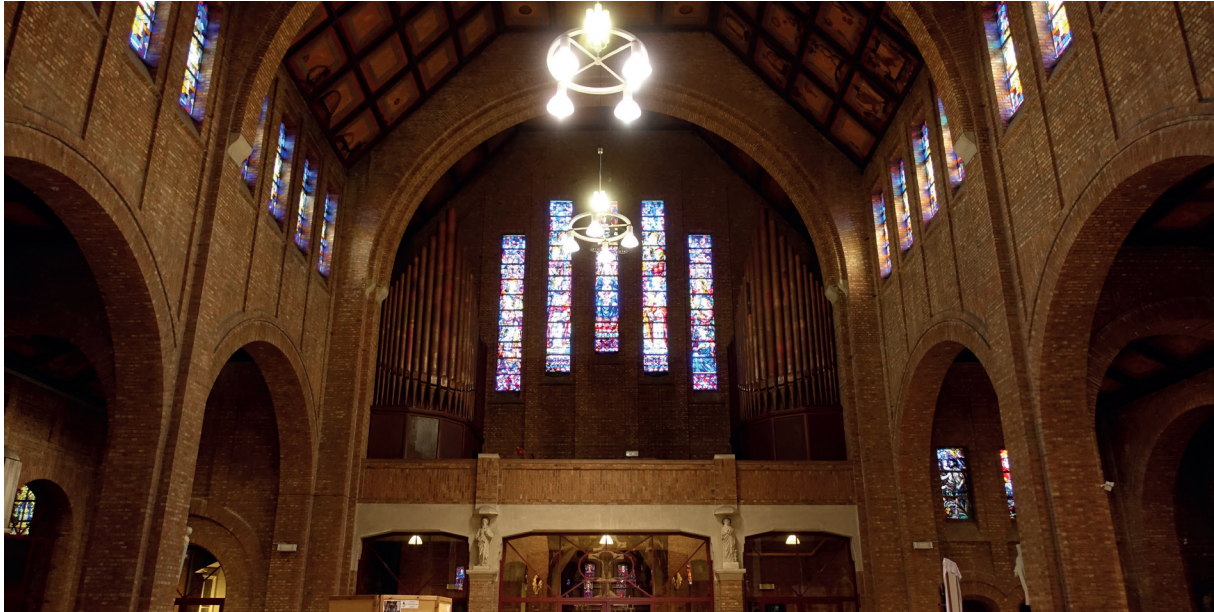
afb. 1: Zicht op het doksaal met het orgel