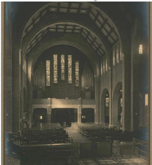
afb. 4: Zicht op de zuidzijde van de kerk