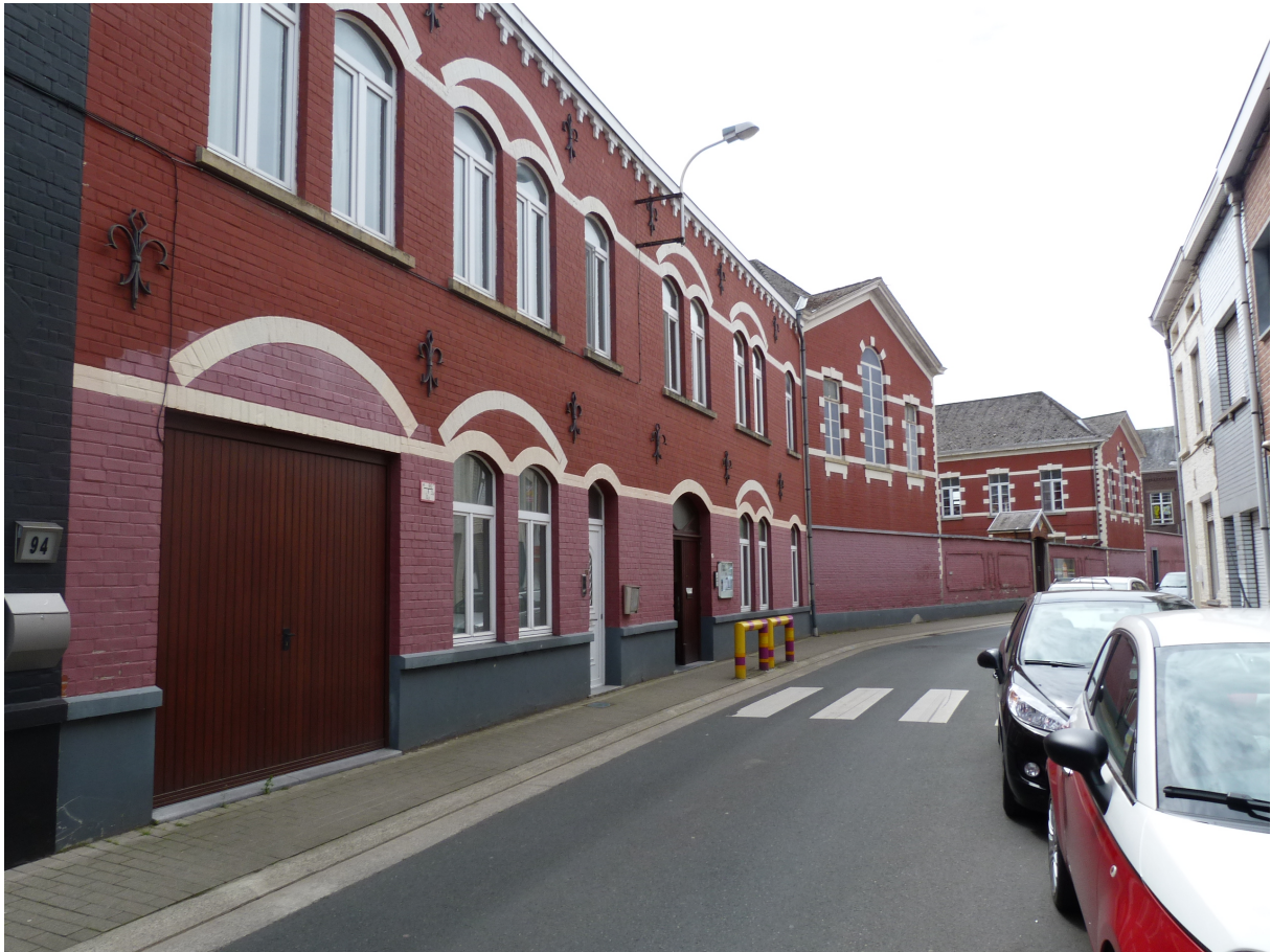
Foto 1 – Zicht op straatvleugel anno 1904 – 1906 vanaf de Gasthuisstraat