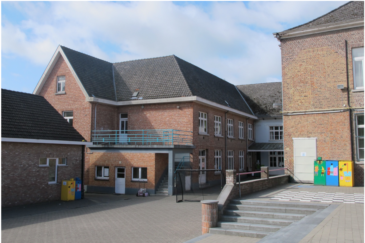
Foto 11 – Uitbreiding anno 1947 en niveauverschil van de speelplaats