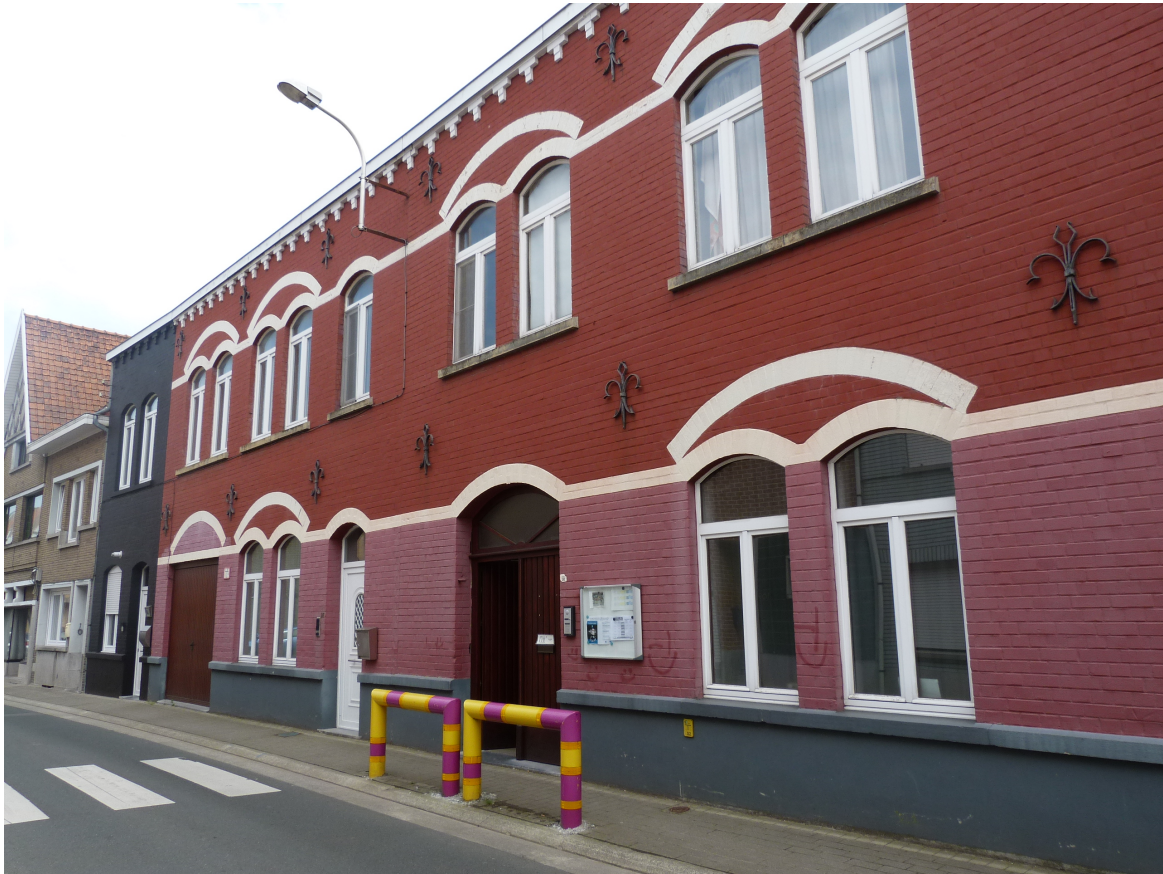
Foto 3 – Zicht op straatvleugel en aansluitende private woning vanaf de Gasthuisstraat