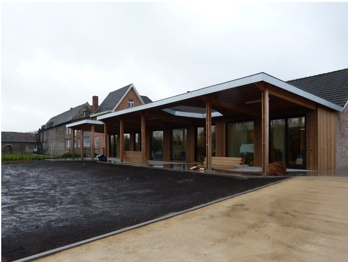
Foto 18 – Zicht op luifel anno 2016 aan tuinzijde schoolgebouw 1988