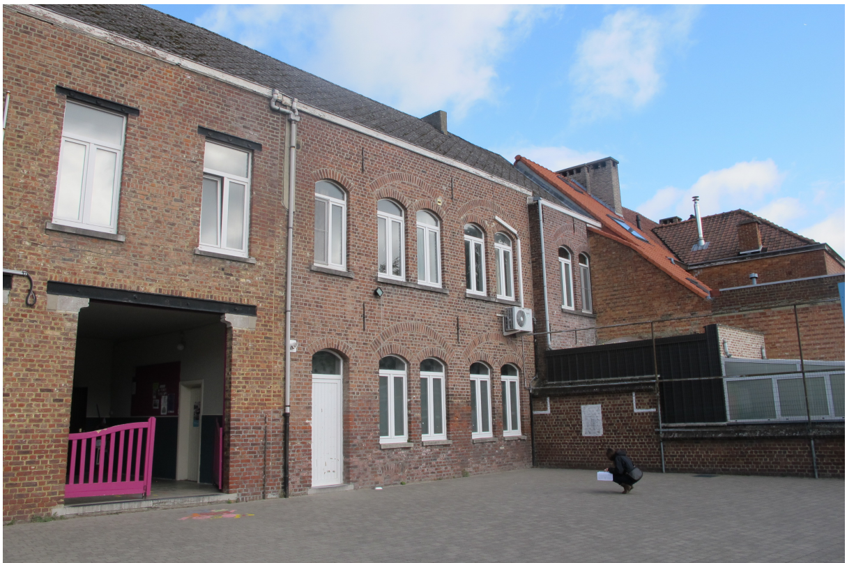
Foto 10 – Achtergevel straatvleugel en private woning vanaf speelplaats