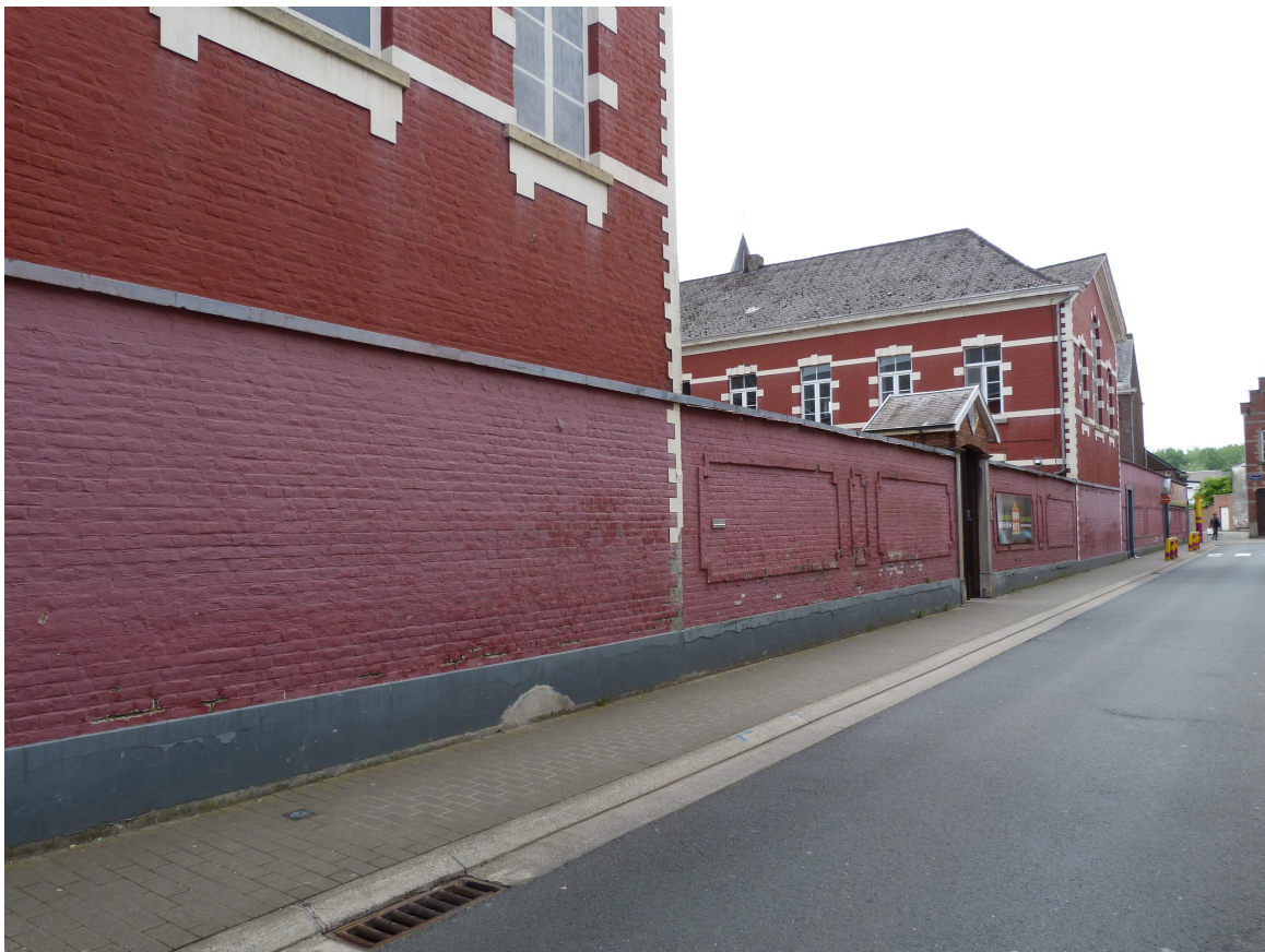
Foto 4 – Zicht op straatmuur aan binnenhof U-vormig inkomgebouw langs Gasthuisstraat