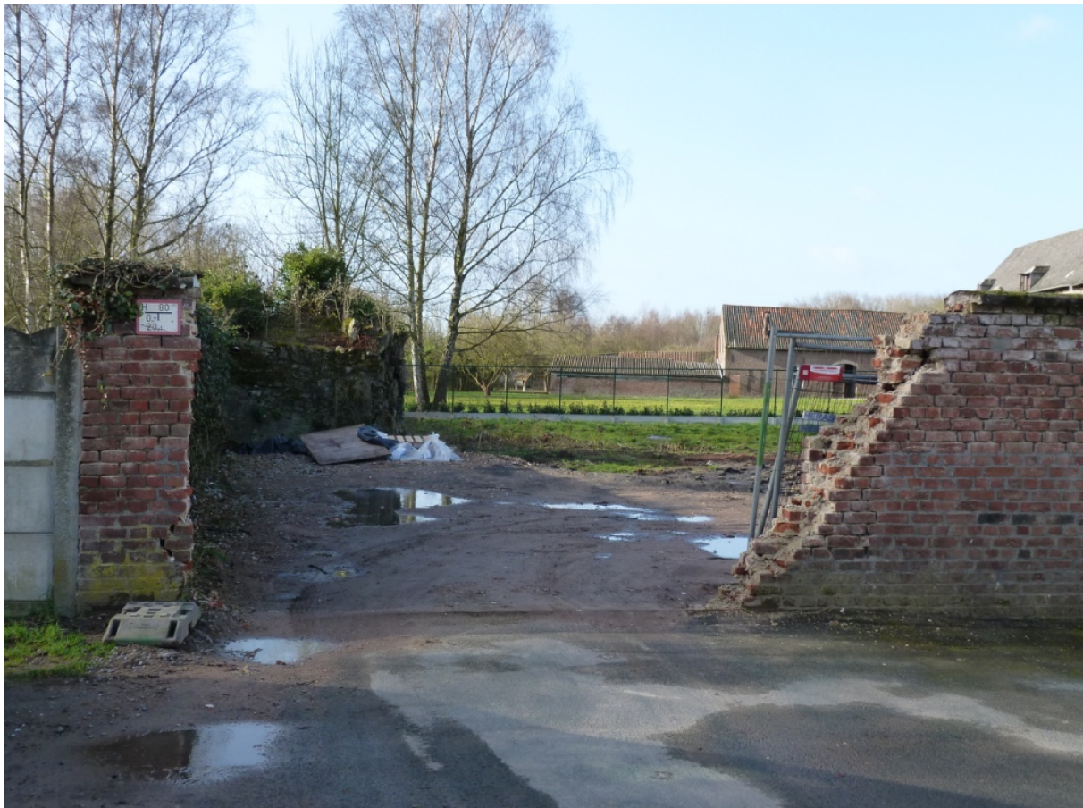
Foto 20 – Zicht op kloostertuin en gebedsgrot doorheen opening in schoolmuur