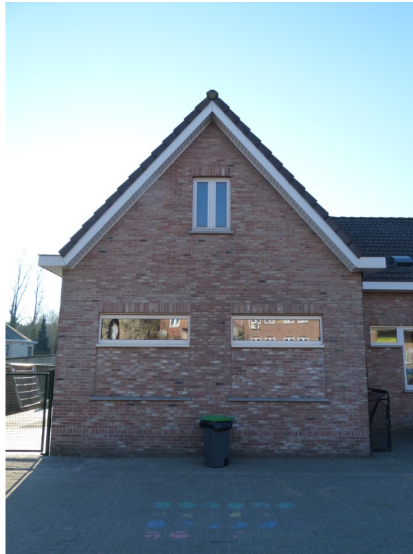
Foto 15 – Korse gevel haaks volume L-vormig schoolgebouw anno 1988