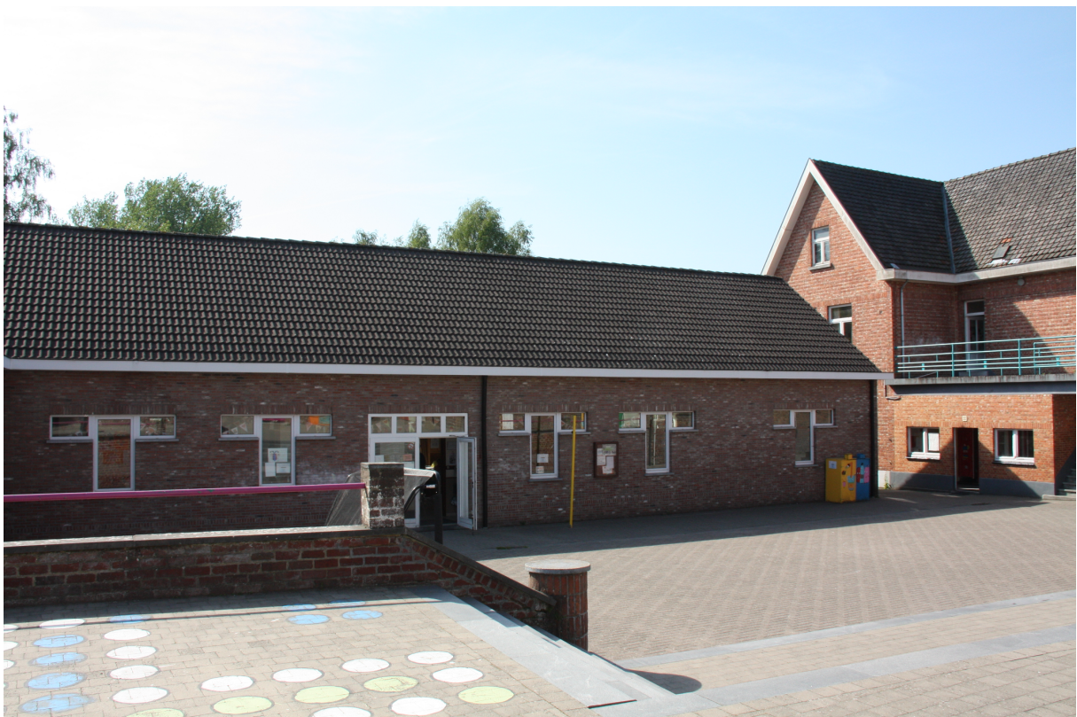
Foto 14 – Zicht op L-vormig schoolgebouw anno 1988 vanaf speelplaats