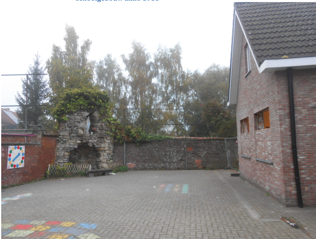
Foto 16 – Zicht op Lourdesgrot en schoolmuur naast L-vormig schoolgebouw