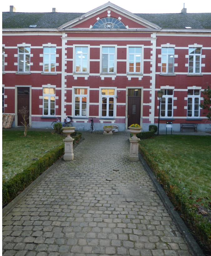
Foto 5 – Geveluitsprong en fronton van centrale vleugel U-vormig inkomgebouw