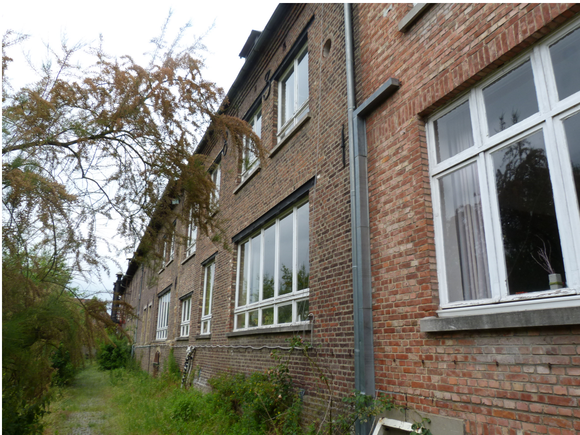
Foto 24 – Zicht op gevels schoolgebouw anno 1833 en zuidoostelijke vleugel kloosterpand langs kloostertuin