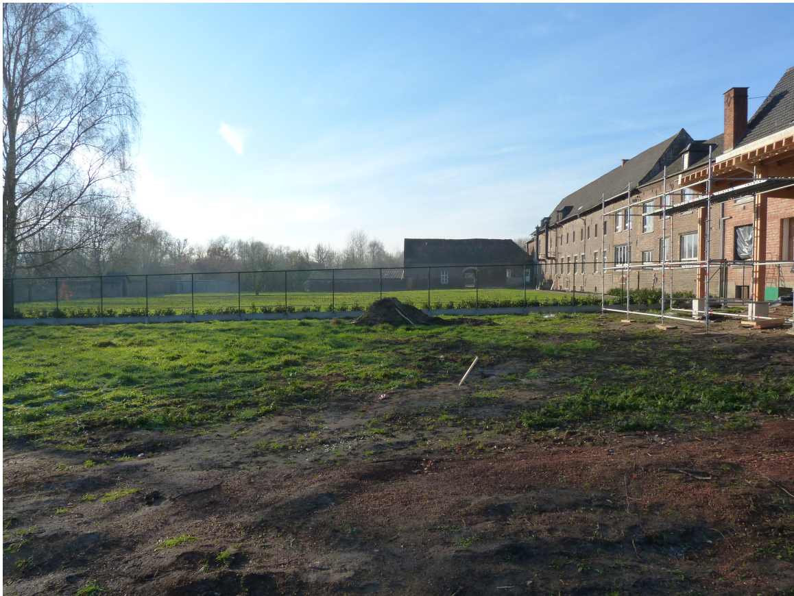
Foto 22 – Zicht op voormalige kloostertuin met onderverdeling tussen school en voormalige priorij