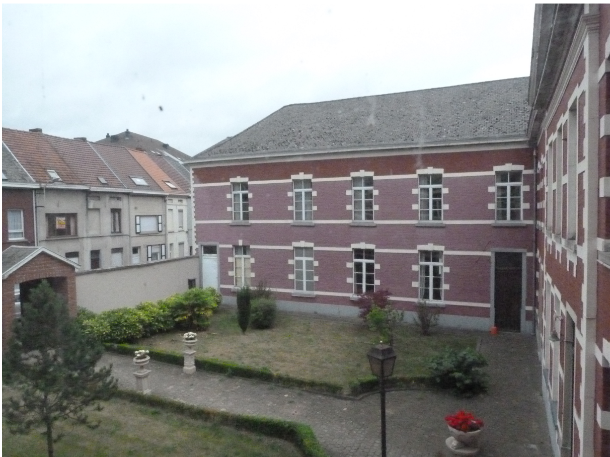
Foto 6 – Zijgevel van oostelijke vleugel U-vormig inkomgebouw en binnenhof