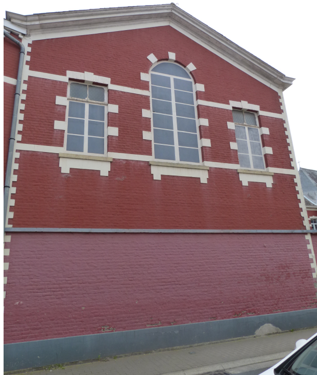
Foto 2 – Kopse gevel van de oostvleugel van het U-vormig inkomgebouw