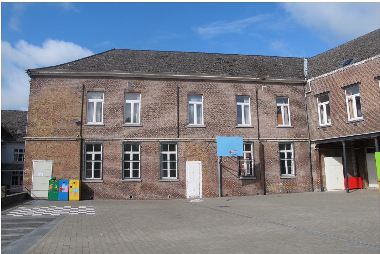
Foto 8 – Achtergevel oostelijke vleugel U-vormige inkomgebouw vanaf speelplaats