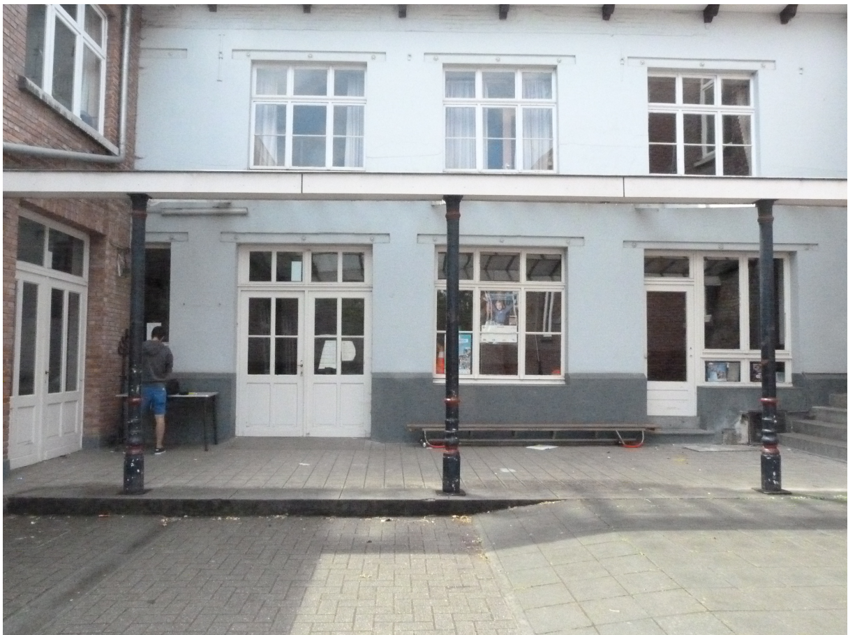
Foto 12 – Luitel anno 1926 aan noordoostelijke vleugel kloosterpand